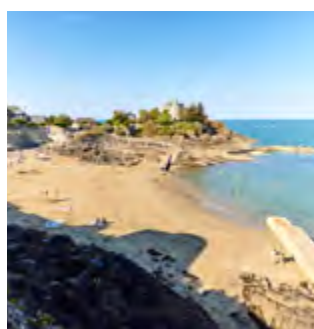
PLAGE DE LA GRÈVE NOIRE Plage intimiste