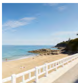
PLAGE DU CHÂTELET Abritée par la falaise