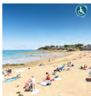
PLAGE DU CASINO Grande plage familiale

Le + : Grâce à la topographie de la côte quinoocéenne, la mer ne se retire jamais loin. Baignade garantie à toute heure, même par grandes marées !