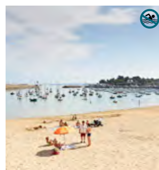
PLAGE DU PORTRIEUX Face au port d'échouage