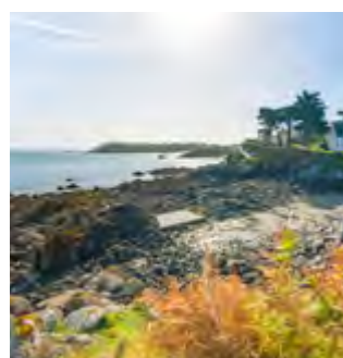
GRÈVE DE FONTENY Lieu de tranquillité