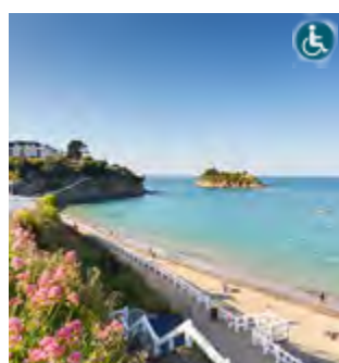
PLAGE DE LA COMTESSE Accès à l'île à marée basse