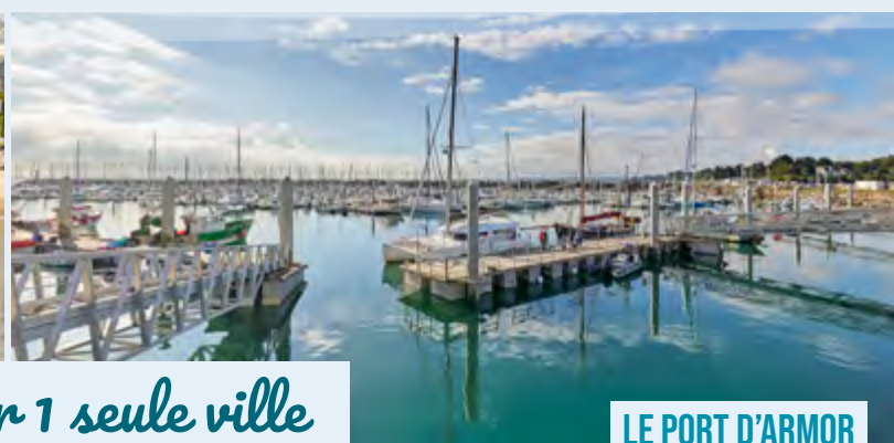
LE PORT D'ARMOR

Ancien port de pêche et de marchandises, le Portrieux est aujourd'hui dédié à la plaisance. Ce port d'échouage conserve tout le charme typique d'un port breton et vit au gré des marées.